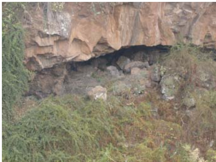
Estado actual de los Cabezazos

El entorno existente alrededor de las Plazas de San Marcos y de La Arañita constituye el núcleo fundacional del municipio y en el que se encuentran enclavadas las principales edificaciones tradicionales que se han conservado a lo largo del tiempo, lo que ha venido definiendo la presencia física de la historia en este lugar y que contribuye a la identificación de los habitantes del municipio con su historia y sus precedentes.