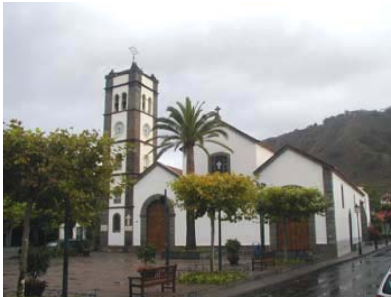
Plaza de San Marcos

Por lo expuesto, podemos determinar que a excepción del Llano, la configuración urbana del casco histórico del municipio se desarrolla entre los siglos XVIII Y XIX, coexistiendo tipologías arquitectónicas de este periodo, con las construcciones del presente.