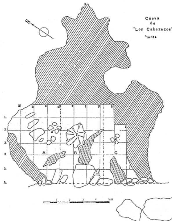
Fig. 2.—Planta de la cueva de «Los Cabezazos»: x, conjunto de mesa de piedra, asientos y hogar; y, situación del pozo de relicto; z, restos de un hogar.

“El yacimiento, sobre su valor arqueológico, tiene el paleo etnológico, muy importante para el conocimiento de un pueblo que entra en la historia con una carga ergológica decididamente prehistórica.”