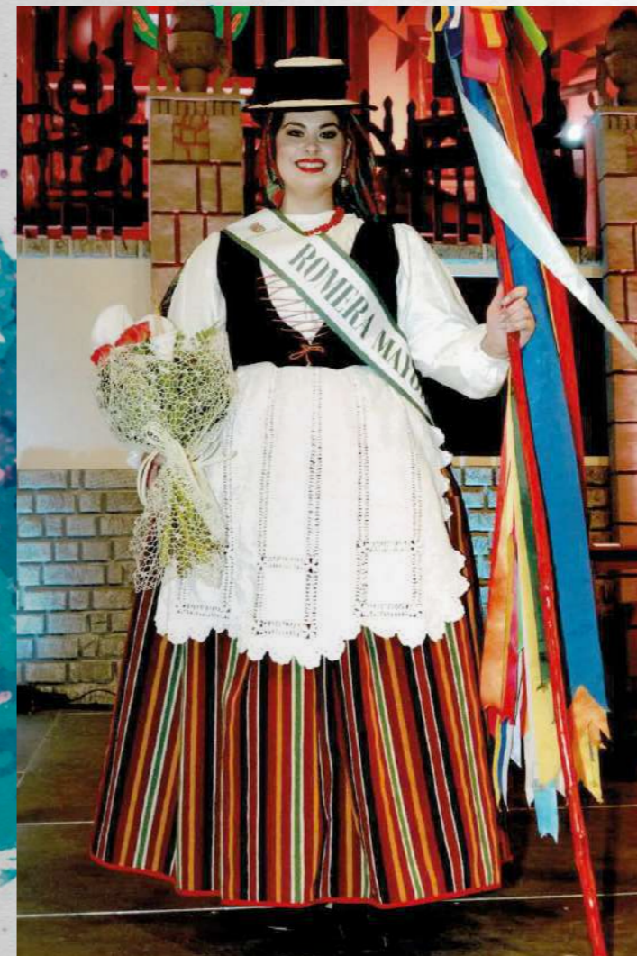
Marta García López Romera Mayor