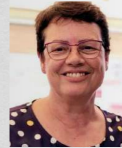
Ana Rosa Mena de Dios , Alcaldesa-Presidenta del Excelentísimo Ayuntamiento de la Villa de Tegueste.