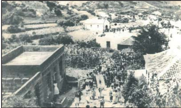
Fiesta Sagrado Corazón Portezuelo

El Portezuelo, segunda mitad de los años 50, mes de junio. Momento de salir de la rutina, matar los cochinos, enjalbegar el frente de las casas y muros y limpiar el camino. Se acerca la celebración de las fiestas del barrio. Llega el domingo, estrenamos los vestidos para acompañar en la procesión al Sagrado Corazón de Jesús, en aquel entonces una imagen pequeña. Delante, una mujer portaba el estandarte y dos niñas sujetaban los cordones que colgaban por los lados; tres niños de monaguillos llevaban las cruces y detrás el cura, el alcalde, el presidente de la fiesta, la reina, las damas de honor y a continuación los fieles.