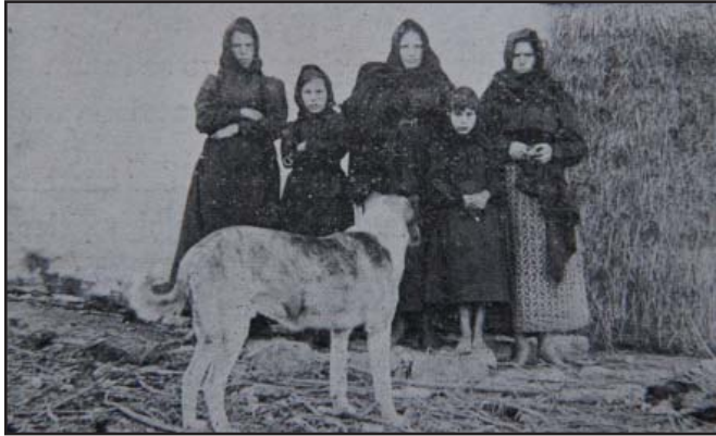
Viuda y hermanas de la víctima. A la izquierda, se aprecia parte de una casa pajiza y, en primer término, el perro Porque

(...) el perro de aquellos desgraciados labradores, un hermoso mastín, de raza isleña, que durante la lucha se comportó como un bravo, peleando hasta caer herido en el pecho, y después de ella se resignó como un cristiano acompañando toda una noche, sobre el verdor de unos trigos húmedos, el ensangrentado cadáver de su amo (...) 4