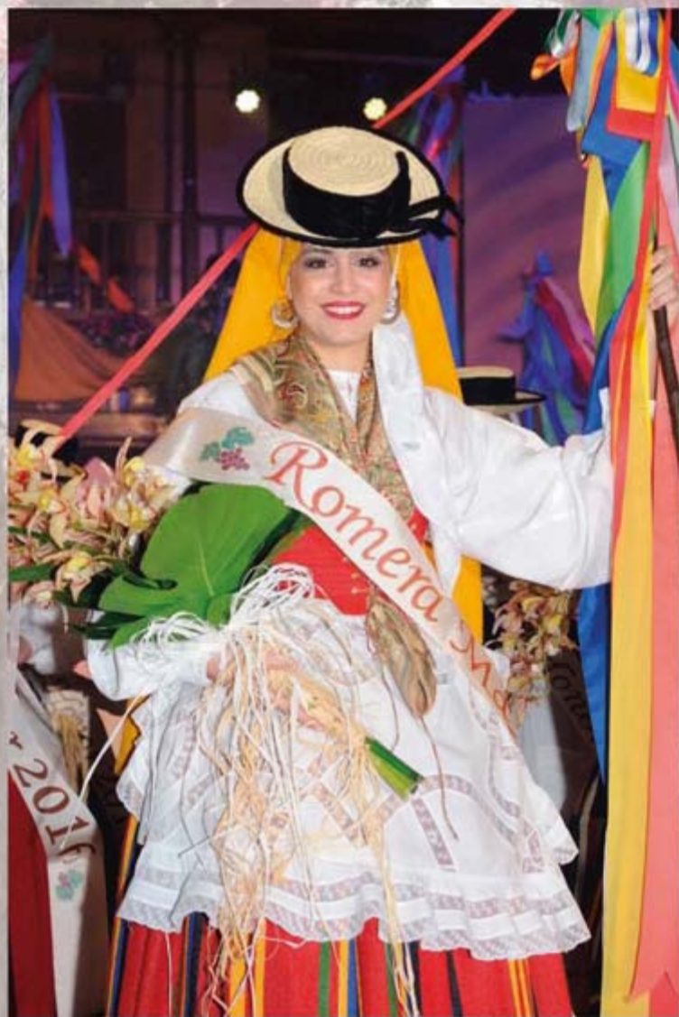
Ivana Díaz Cedrés Romera Mayor 2016